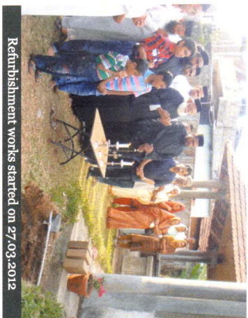
Refurbishment works started on 27.03.2012

മലങ്കര ഓർത്തഡോക്സ് സുറിയാനിസഭാ നേതൃത്വത്തിന്റെ ആജ്ഞാനുസരണം കുന്നൻകുരിശു തീർത്ഥാടനകേന്ദ്ര വികസന കൗൺസിൽ താഴെ വിവരിക്കുന്ന പ്രകാരം പ്രവർത്തനം നടത്തിക്കൊണ്ടിരിക്കുന്നു: